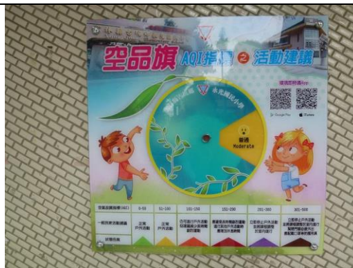
照片說明：中廊規劃校園雙語互動標示牌施作完成