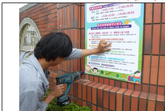
照片說明：校門口設置校園開放雙語標示牌施作