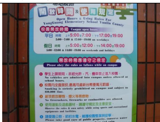
照片說明：校門口設置校園開放雙語標示牌施作完成