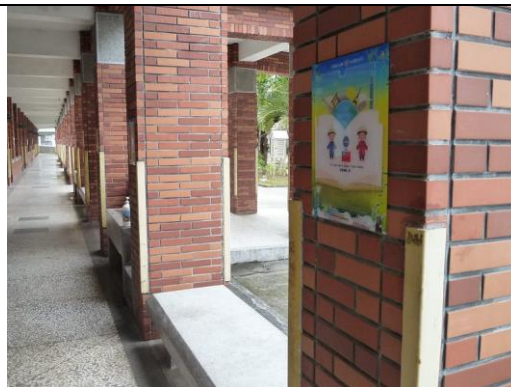
照片說明：走廊、廁所設置雙語抽取式壓克力盒施作完成