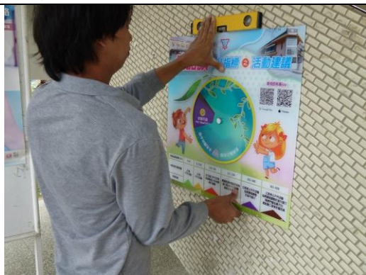
照片說明：中廊規劃校園雙語互動標示牌施作